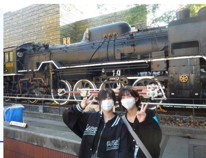
【東京ドームシティアトラクションズ】