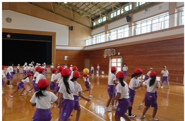
「自分達で進めるドッジボール大会」